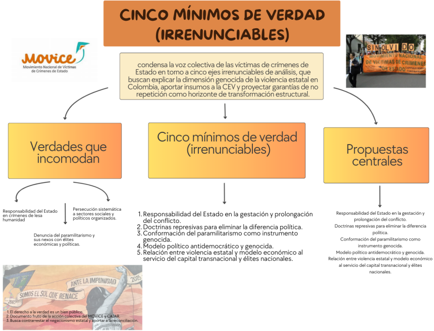
Figura 5 Los Cinco Mínimos de Verdad