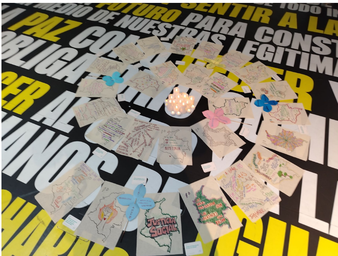
Figura 3 Ejercicio de Memoria Colectiva

Fuente. Tomada en el Cierre de la Exposición Hay Futuro Si Hay Verdad, Centro de Memoria Histórica, Diciembre 2024.