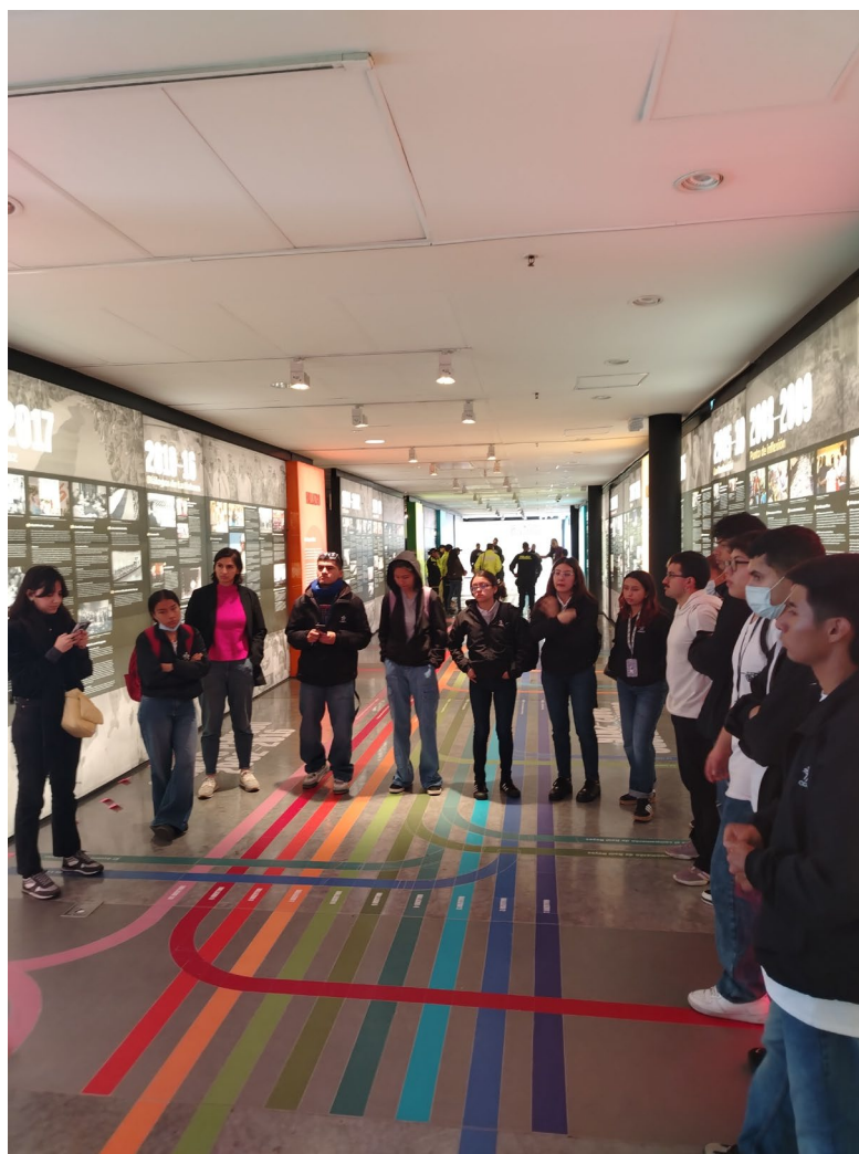
Figura 2 Cierre Exposición Hay Futuro Si Hay Verdad

Durante las horas que estuve allí, tomé fotografías como una manera de no olvidar lo que mis ojos y mi corazón estaban registrando y observé atentamente a las personas que transitaban por el espacio. La mayoría eran estudiantes de colegios y universidades, acompañados por docentes que, con evidente compromiso pedagógico, intentaban explicar la historia reciente del país. Muchos jóvenes se quedaban perplejos frente a los testimonios de la guerra: para buena parte de ellos, nacidos y criados en ciudades, el conflicto era un fenómeno lejano, casi abstracto, más asociado a series de Netflix que a la vida cotidiana de millones de colombianos. Me impresionaba ver sus rostros sorprendidos frente a relatos.