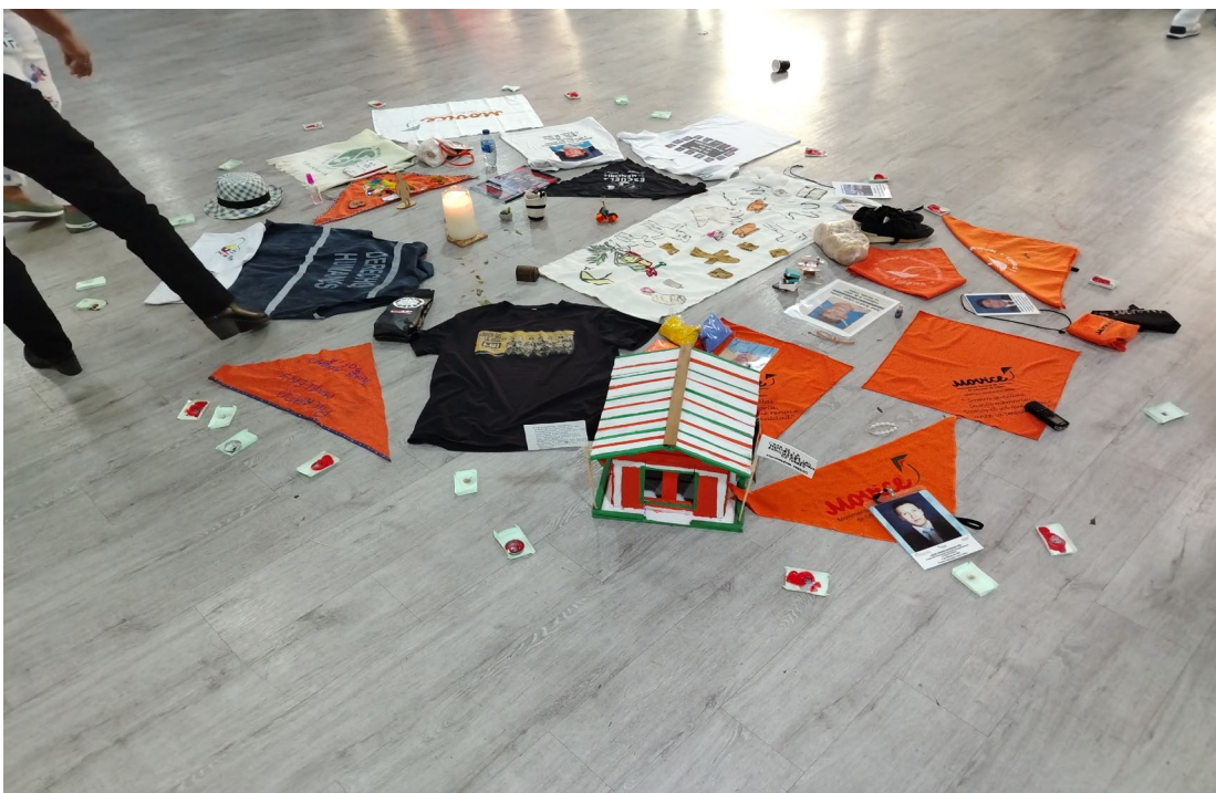
Figura 6 Escuela de memorias