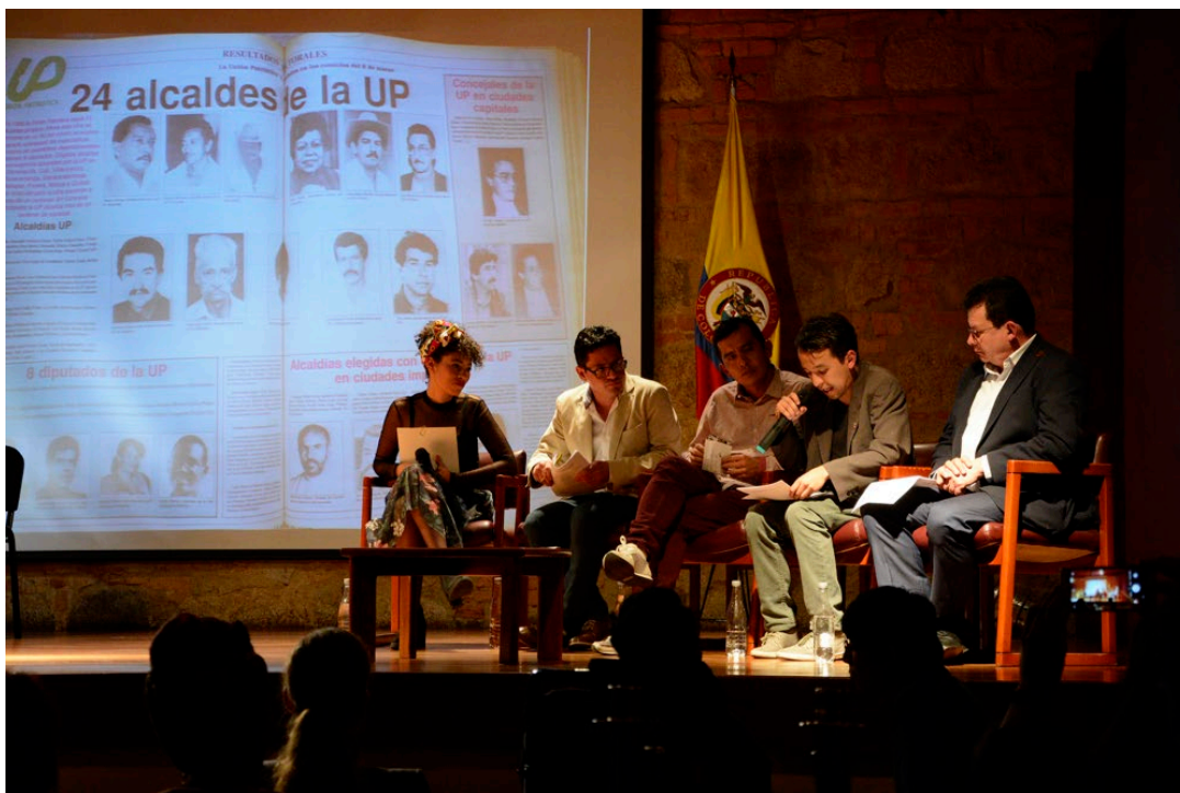
Figura 4 Conmemoración Unión Patriótica