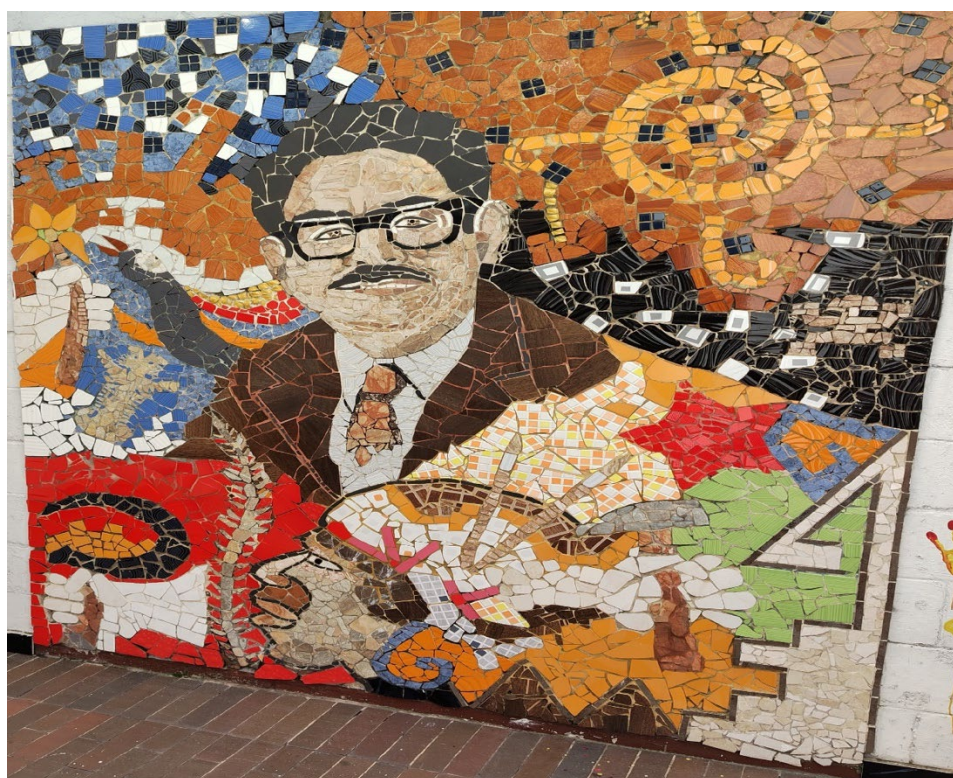
Figura 7 Mural Homenaje a Manuel Cepeda Vargas