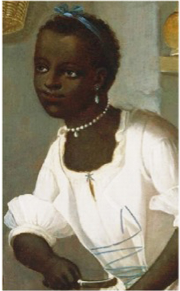
Gráfica 2 Negra con collar y pendientes de perla. José de Páez.

de su persona, sobresaliente buen color, su buen trato, índole virtuosa y demás recomendables circunstancias que la distinguen de ser buena calidad”. 24