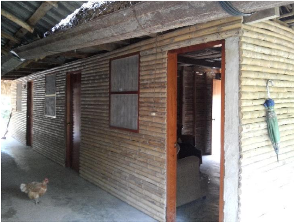
Fotografía 4. Casa de Salud, Tanchahuil, San Antonio , SLP.