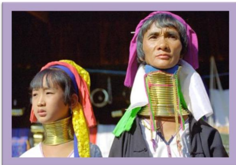
Mujeres jirafa de Tailandia

Los comentarios que realizaron fueron que estaba muy maquillada, no dijeron mucho de esta imagen.