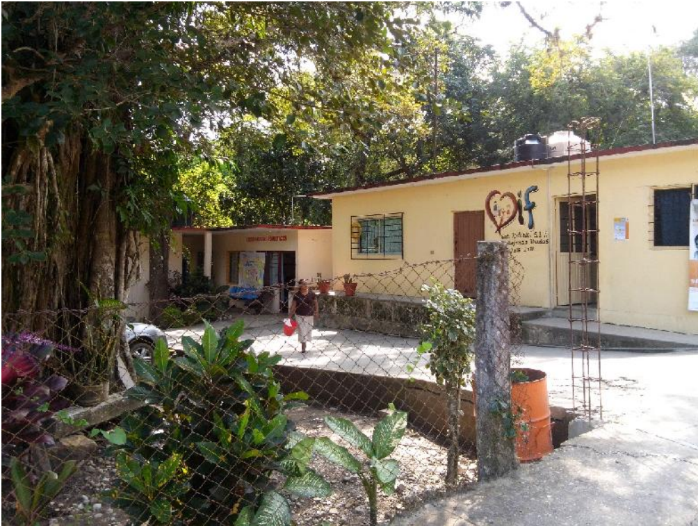
Fotografía 6. Mujeres de la comunidad de Lejem, San Antonio, SLP