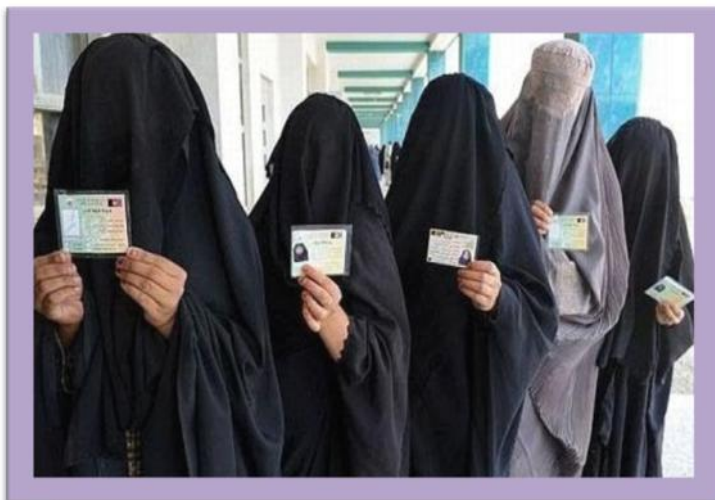
Mujeres de Israel / Musulmanas con Burka

Los comentarios realizados sobre esta imagen, es que pensaron que era hombres por no tener cabello, y con esta idea, preguntaron qué los hombres cargaban a sus hijos de la misma forma que lo hacen las mujeres de la comunidad. Una vez aclarado que son mujeres, preguntaron que por qué se rapaban. Dijeron que no les gustaría raparse la cabeza.