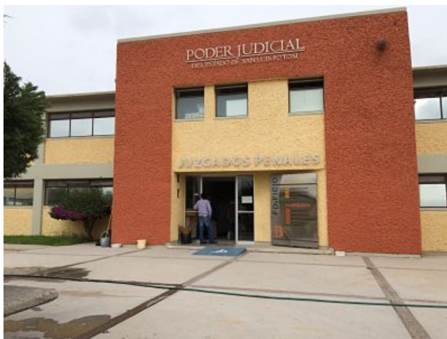
Ilustración 2: Edificio de los Juzgados Penales