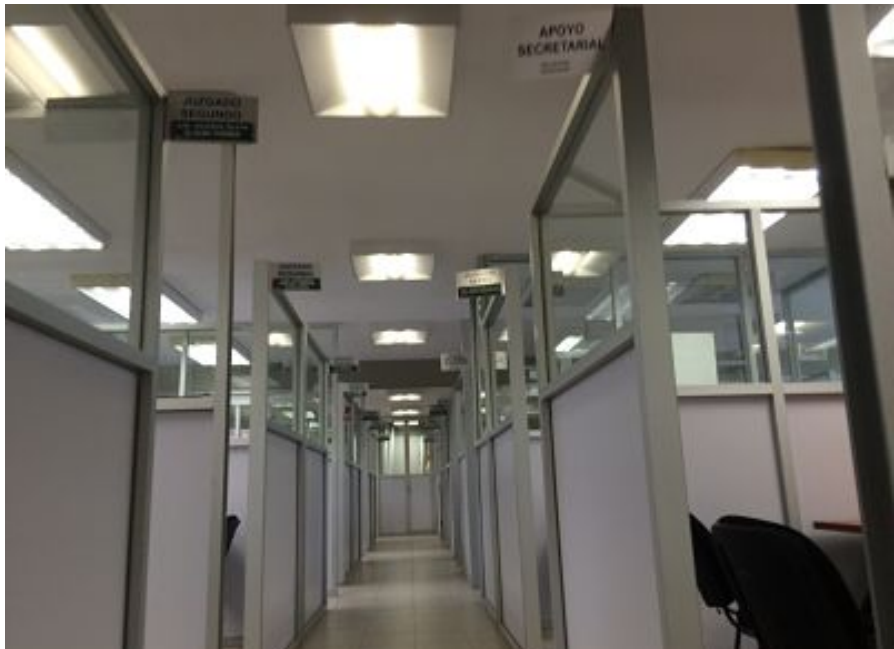
Ilustración 4: Dentro de la Defensoría Pública Penal