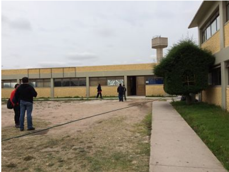
Ilustración 2: Edificio de la Dirección de la Defensoría Pública Penal