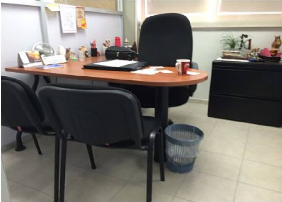
Ilustración 5: Cubículo de un defensor público