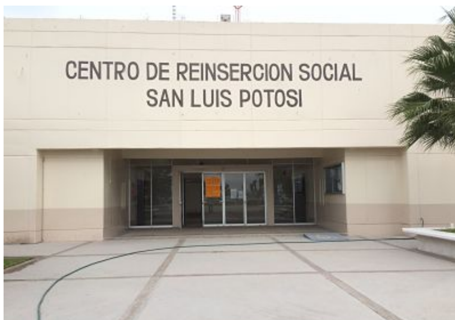
Ilustración 1: Entrada al CERESO y a sus oficinas administrativas.