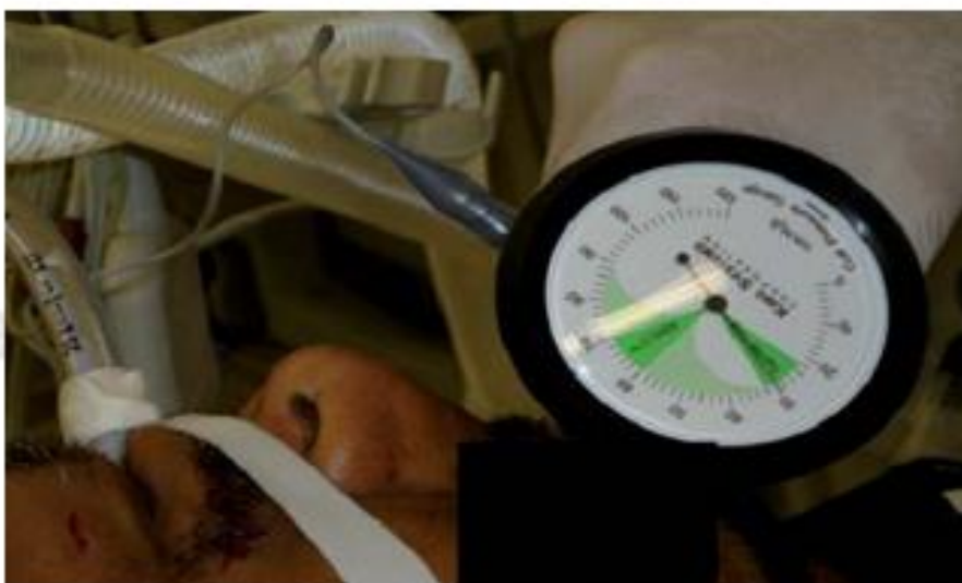
Figura 2. Corrección de la presión del globo endotraqueal.

Fuente: Félix, López D, Carrillo O. Evaluar la precisión de las técnicas subjetivas de insuflación del globo endotraqueal. Rev Mex Anest [internet] 2014 [citado 2017 May 08]; 37 (2):71-76. Disponible en: www.medigraphic.com