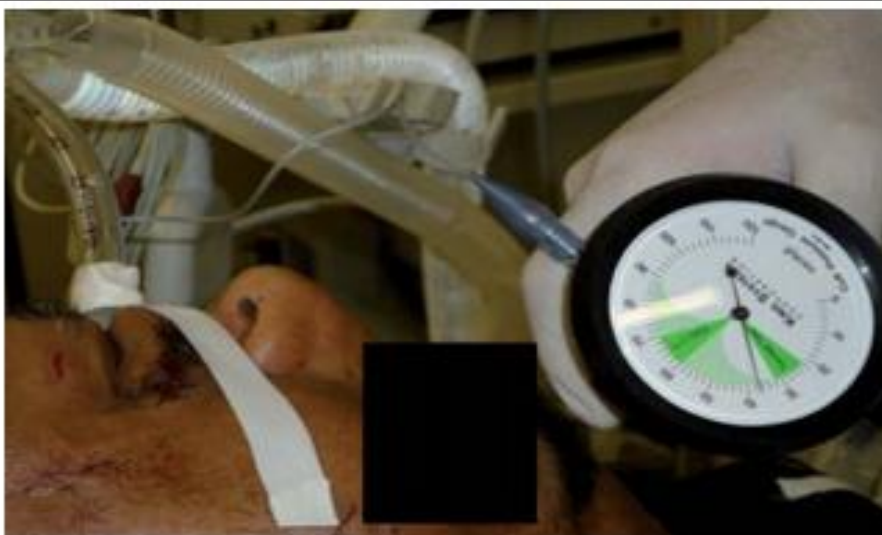
Figura 1. Medición de la presión del globo endotraqueal.

El método objetivo de medición del insuflado del globo es donde se utiliza una herramienta especializada llamada manómetro, esta sirve para medir la presión del globo endotraqueal conectando directamente al balón piloto del tubo endotraqueal.