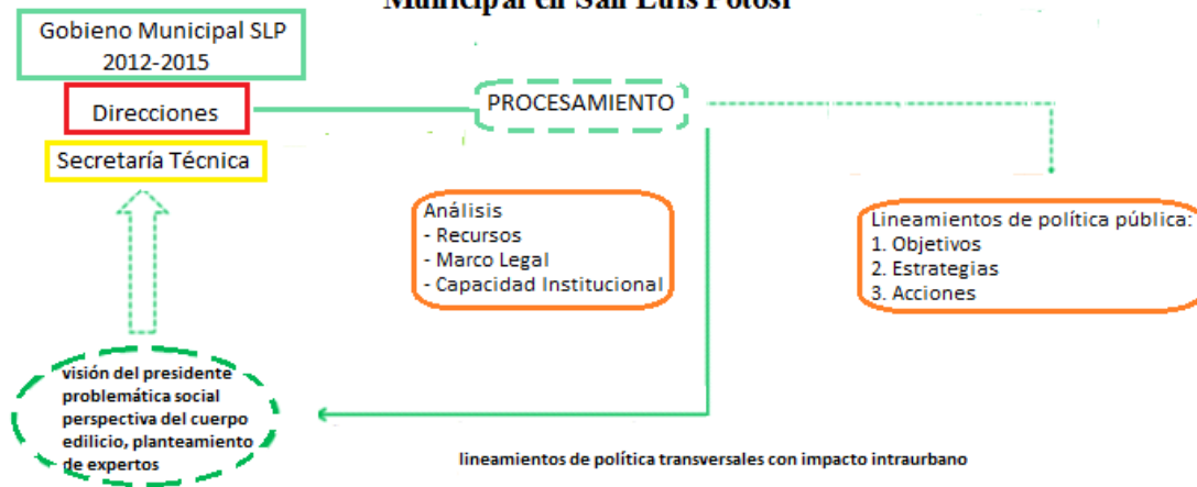
Imagen 1. Proceso del Diseño de acciones de Política Pública Municipal en San Luis Potosí