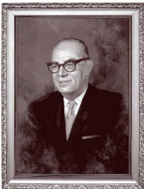
Dr. Ignacio Morones Prieto (1940-1944)